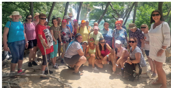
Výlet do Národného parku KRKA, Chorvátsko

morského vzduchu. V rámci zájazdu sme absolvovali aj výlet loďou do Národného parku Krka, kde sme obdivovali nádherné vodopády.