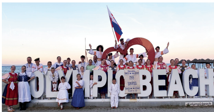
DFS Juránek na folklórnom festivale Paralís v Grécku

ešte vystúpenie na 1. mája a samozrejme Krojové slávnosti, čím sme uzatvorili prvú polovicu podujatí, ktoré pravidelne v obci pripravujeme. A keďže máme medzi našimi folklórnymi partnermi množstvo priateľov, sľúbili a opätovali sme návštevu a vystúpenia zase pre ich divákov. Na konci júna sme sa tak vybrali do gréckej Paralíe na folklórny festival a začiatkom septembra potešíme folkloristov a divákov v bulharskom Radneve. Školský rok sme ukončili na MFF Strážnice 2024, kde naši muzikanti mali česť vystúpiť spolu s ďalšou stovkou mladých muzikantov v programe Muzičky a zažiť tak radosť a šťastie z toho, čo ich spája a to je hudba a tradície, ktorým venujú takmer všetok svoj voľný čas. Muzičkami sme otvorili dvere letu a druhú polovicu roka plánujeme v lete obohatiť tradičným letným kinomaratónom a to hneď tromi podujatiami. Pripravené je premietanie pre dospelých aj deti a pre tých najmenších aj vystúpenie skvelej skupiny Fidlikanti deťom. Samozrejmosťou budú aj tradičné posedenia pri cimbálke v spolupráci s reštauráciou Dolina a chýbať nebudú ani naše skvelé letné tábory, kde sa deti rovnako venujú kreatívnym činnostiam.