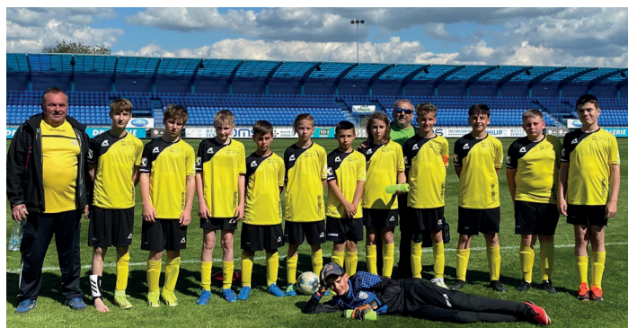
Mladší žiaci U13 a ich tréneri